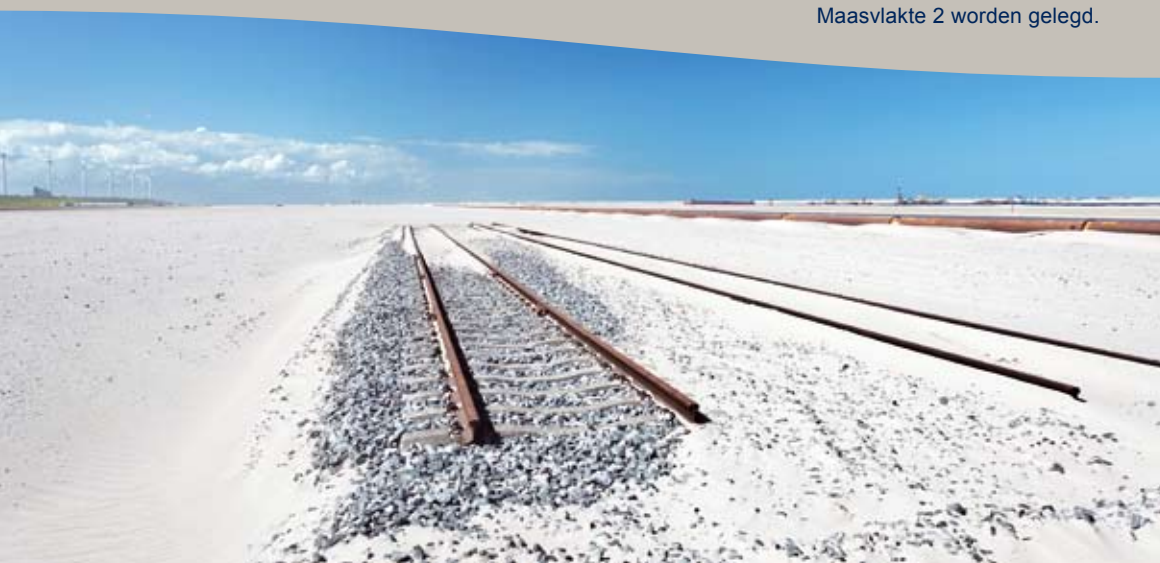
Eerste 100 meter spoor op Maasvlakte 2

Dat moet in de toekomst 20 procent worden. ■