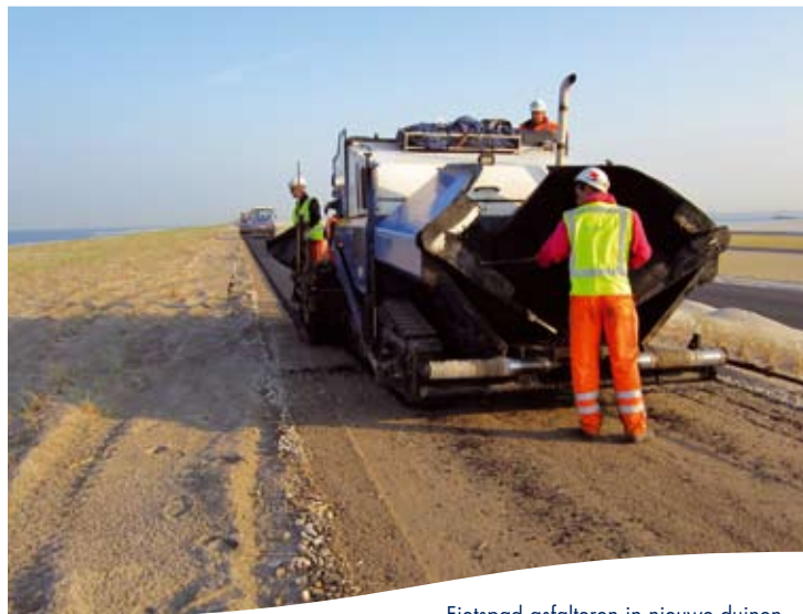
Fietspad asfalteren in nieuwe duinen

Voor wie die col een brug te ver is, gaat vanaf november 2012 het fietspad langs de infrastructuurbundel van Maasvlakte 2 open. Dit fietspad loopt vanaf de fietsroute langs het Oostvoornsemeer, via de buitenrand van Maasvlakte 2 naar de Maasmond. Langs de kust ligt het fietspad bovenop de duinen. Hierdoor