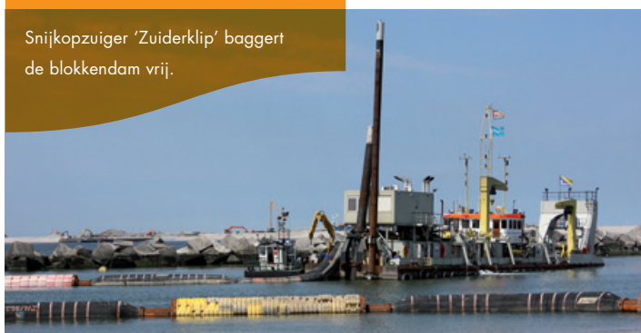
Snijkopzuiger 'Zuiderklip' baggert de blokkendam vrij.