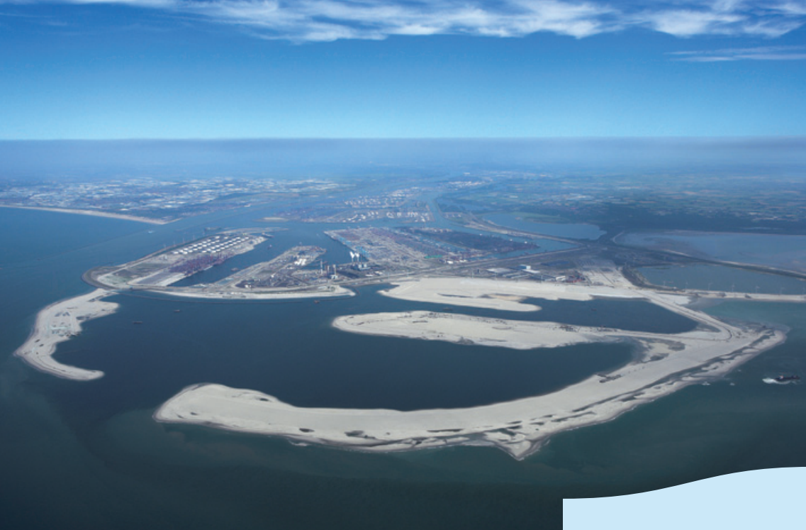
Maasvlakte 2, juli 2010