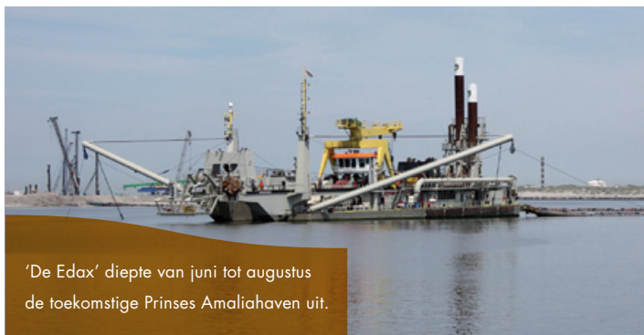
'De Edax' diepte van juni tot augustus de toekomstige Prinses Amaliahaven uit.

De komende tijd moet 530 hectare havenbassin worden uitgediept tot ongeveer zeventien meter onder NAP. Later worden de havenbekkens verdiept tot 20