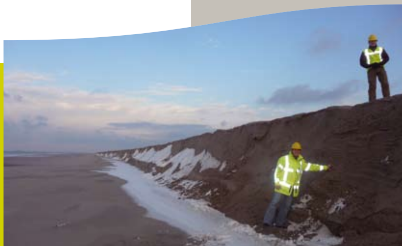
Het klassieke zandkusttalud zie je ook op het nieuwe land.

om op gunstiger werkomstandigheden te wachten. Toch werkt het weer wel tegen. Het zand dat met man en macht is opgebracht, kan tijdens het stormseizoen (van oktober tot april) wegspoelen of zelfs weggeslagen worden. PUMA houdt rekening met 2 à 3 procent van het zand dat door storm en zeestromen opnieuw moet worden aangebracht. Een groot deel van het weggespoelde