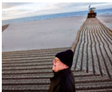
Jan Dibbets - '6 Hours Tide Object with Correction of Perspective, 2009'.

Museum Boijmans Van Beuningen maakte er een tentoonstelling van. De haven en Maasvlakte 2 bekeken door de ogen van kunstenaars, levert heel verschillende invalshoeken, beelden en kunstwerken op waarbij de haven als economisch fenomeen zeker niet de enige rol speelt. In een van de (video) kunstwerken cirkelt een camera rond een nog