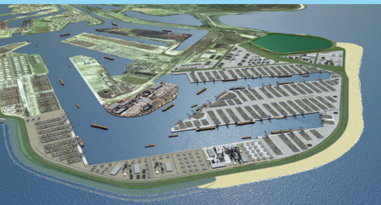
Maasvlakte 2 in 2013