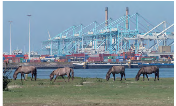
De haven van Rotterdam

Iedere tijd heeft zijn eigen kenmerken. Vandaag de dag willen we van alles kunnen kopen, voor de goedkoopste prijzen. Maar we letten ook meer en meer op het milieu en de manier waarop we produceren. Duurzaamheid is iets waar we tegenwoordig steeds meer op letten.