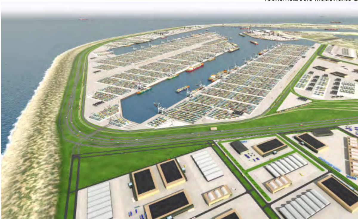
Toekomstbeeld Maasvlakte 2