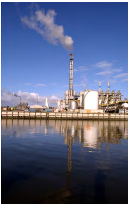
Fabrieken van tegenwoordig hebben zeer goede filters