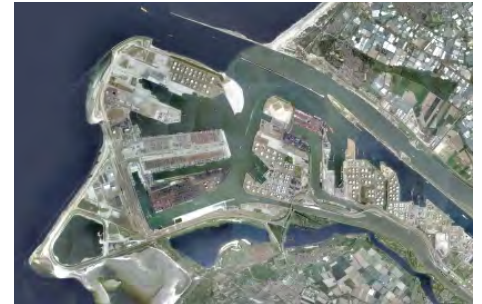
Maasvlakte 1 bestaat al

In deze les kijken we naar de topografie, geschiedenis en economie van de haven.