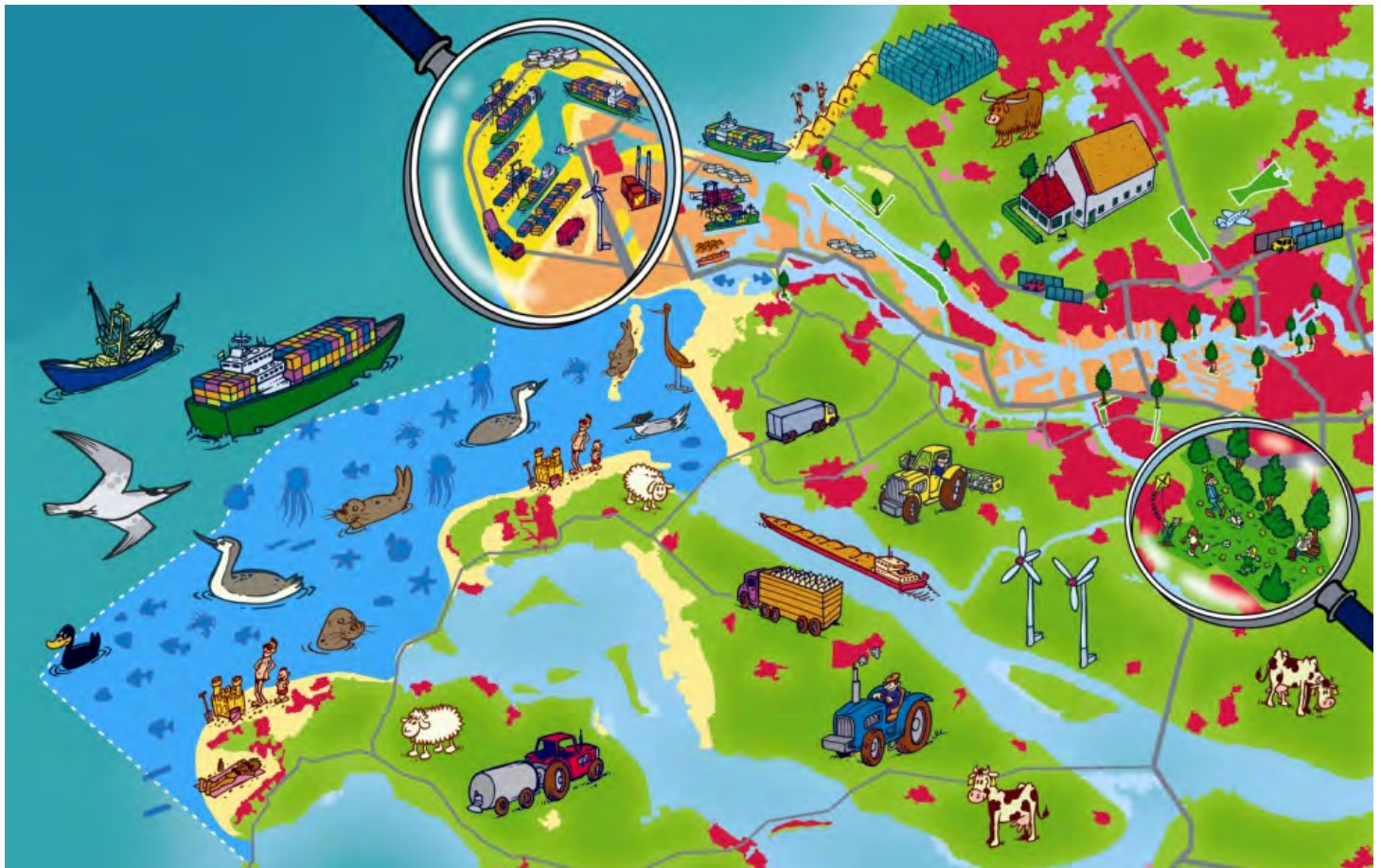
Cartoon Maasvlakte 2 en Voordelta

Veel plant- en diersoorten in het gebied hebben bescherming nodig om voort te kunnen blijven bestaan.