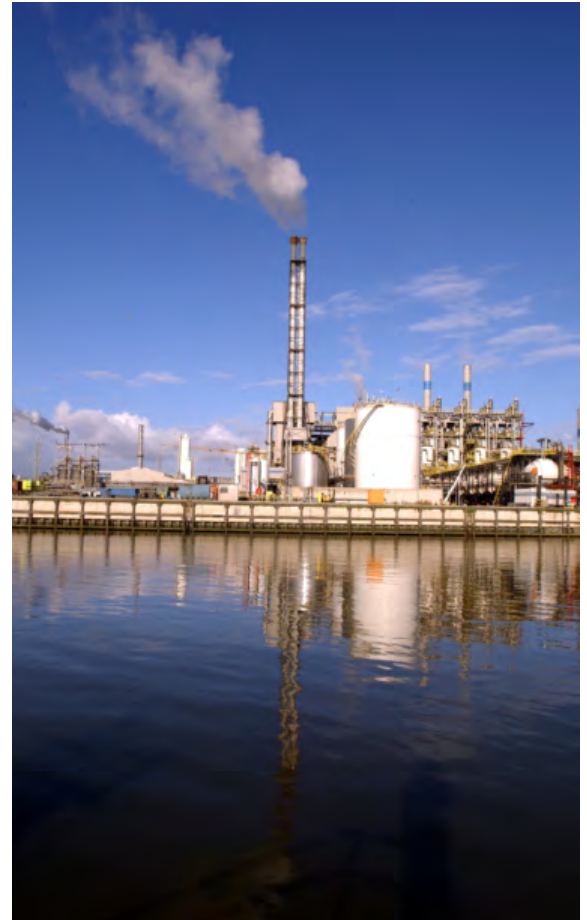
Bedrijvigheid in de haven