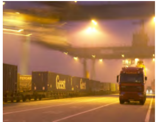
Vrachtwagenverkeer in de haven

Met de aanleg van Maasvlakte 2 wordt extra ruimte gemaakt. Voor de chemische industrie, distributieparken, maar met name voor de grootschalige containersector. Heel veel grote zeeschepen zullen er varen. Binnenvaartschepen, treinen en vrachtwagens transporteren de containers en goederen weer verder. Als er niets zou gebeuren zou dat natuurlijk nadelige gevolgen hebben voor het milieu. Het verkeer zou drukker worden en de uitstoot zou toenemen.