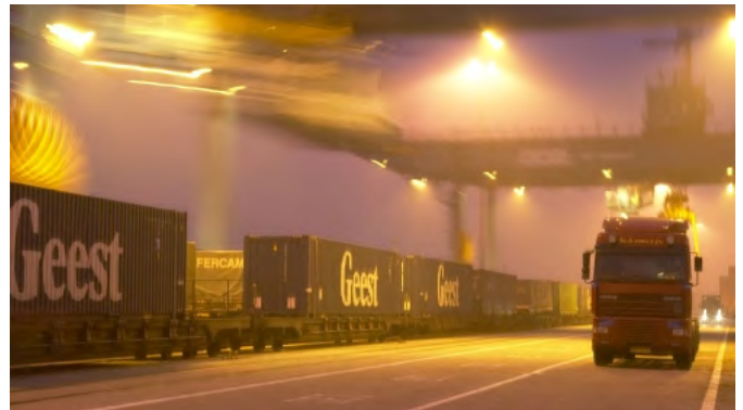
Vervoer in de haven