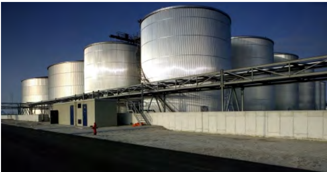
Industrie in de haven

Op Maasvlakte 2 wordt straks ook echt geproduceerd. Er komen fabrieken die grondstoffen of halffabrikaten verwerken tot eindproducten.