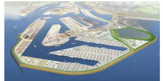
Maasvlakte 2 - toekomstbeeld

Zoek op internet op www.mv2movie.com naar informatie over de aanleg van Maasvlakte 2.