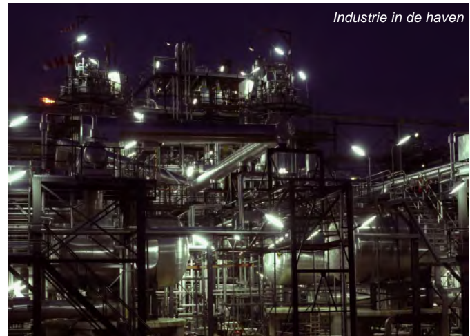
Industrie in de haven