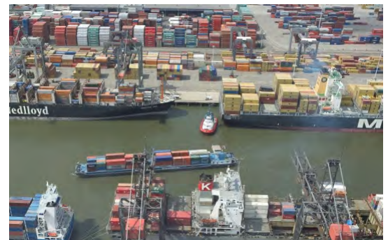
Haven van Rotterdam

Deze les gaat over de duurzaamheid van Maasvlakte 2 en wat er allemaal wordt gedaan om Maasvlakte 2 zo duurzaam mogelijk te laten zijn.