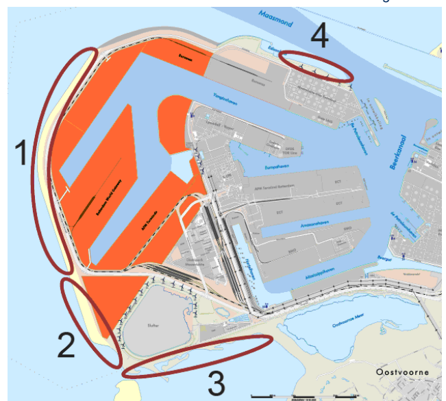
Maasvlakte 2 - Recreatiegebieden