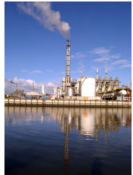
Bedrijvigheid in de haven