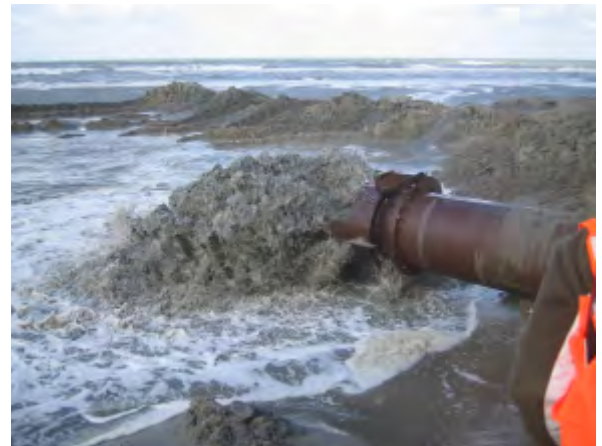
Start aanleg Maasvlakte 2

Dat is uniek in Europa! Kijk maar eens op www.mv2movie.com/film/havendiepte.swf .