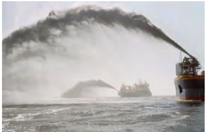
Waterbouwers aan het werk bij Maasvlakte 2