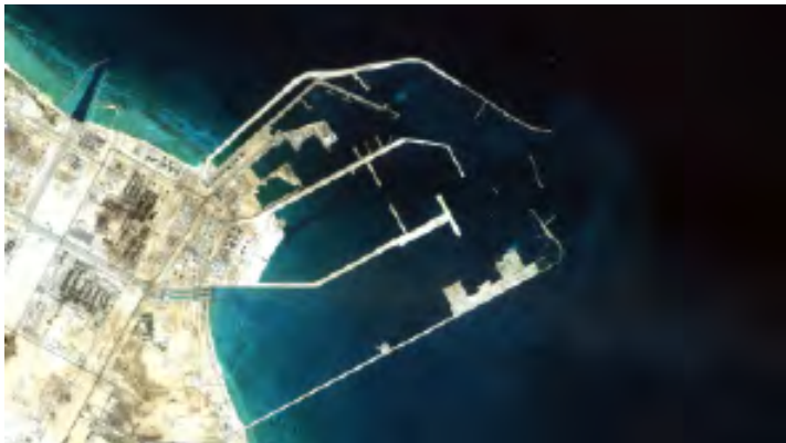
Satelliefoto van de door Boskalis aangelegde haven in Qatar

In 2008 is het aanleggen van Maasvlakte 2 begonnen. Dit doen waterbouwers. Met hun schepen varen ze iedere dag de zee op om zand te halen dat ze naar de plek te brengen waar Maasvlakte 2 gemaakt wordt. Al in 2009 komt het eerste zand van de nieuwe havens boven water. Het begint met een eilandje in zee.