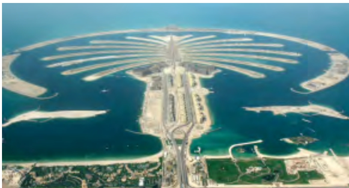
'Jumeirah', de eerste van de drie palmeilanden in Dubai

In 2008 is het aanleggen van Maasvlakte 2 begonnen. Dit doen waterbouwers. Met hun schepen varen ze iedere dag de zee op om zand te halen dat ze naar de plek te brengen waar Maasvlakte 2 gemaakt wordt. Al in 2009 komt het eerste zand van de nieuwe havens boven water. Het begint met een eilandje in zee.